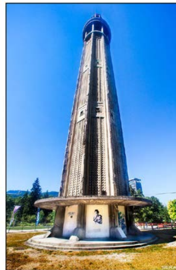
MALCOLM IN FX - BASALT 2016 - Rue du Cloître St Merry - Paris 2016 - Tour Perret - Grenoble Photos & Collage : Seka Feat : Banga, Malcolm & Katia