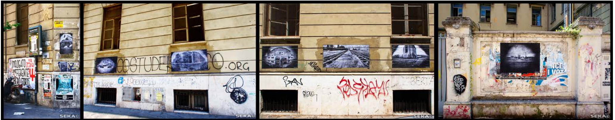
RDF - 2010 - Ecole d'Art Alessandro Caravillani - Face au Vatican - Rome - Italie Photos & Collage : Seka